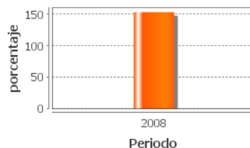
Porcentaje de Avance